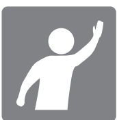
手を上げて下さい