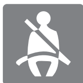
シートベルト着用