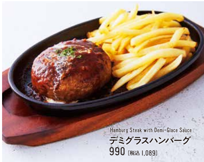
Hamburg Steak with Demi-Glace Sauce デミグラスハンバーグ 990 [税込 1,089]