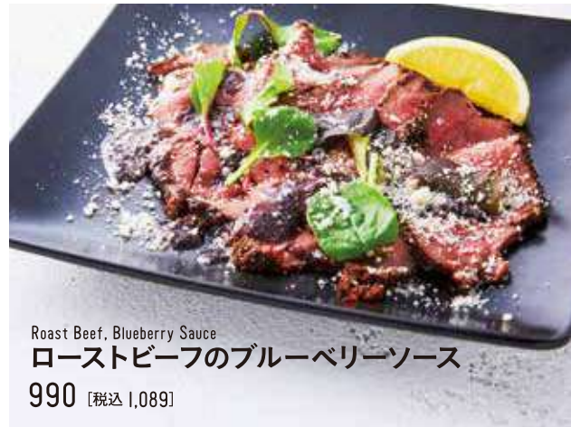
Roast Beef, Blueberry Sauce ローストビーフのブルーベリーソース 990 [税込 1,089]