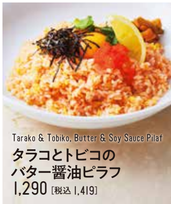
Tarako & Tobiko, Butter & Soy Sauce Pilaf タラコとトビコの バター醤油ピラフ 1,290 [税込 1,419]