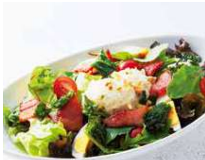
Creamy Truffle Mashed Potatoes Salad クリーミートリュフマッシュポテトサラダ ●5種のナッツドレッシング ※トリュフフレーバーマヨソース使用 レギュラー 890 [税込 979] ハーフ 690 [税込 759]