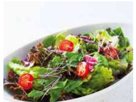
Garden Salad ガーデンサラダ ※ドレッシングをお選びください ●レモンドレッシング ●シーザードレッシング ●濃厚うまみクリーミーサラダソース レギュラー 590 [税込 649] ハーフ 390 [税込 429]