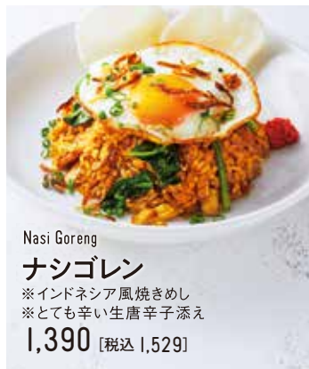
Nasi Goreng ナシゴレン ※インドネシア風焼きめし ※とても辛い生唐辛子添え 1,390 [税込 1,529]