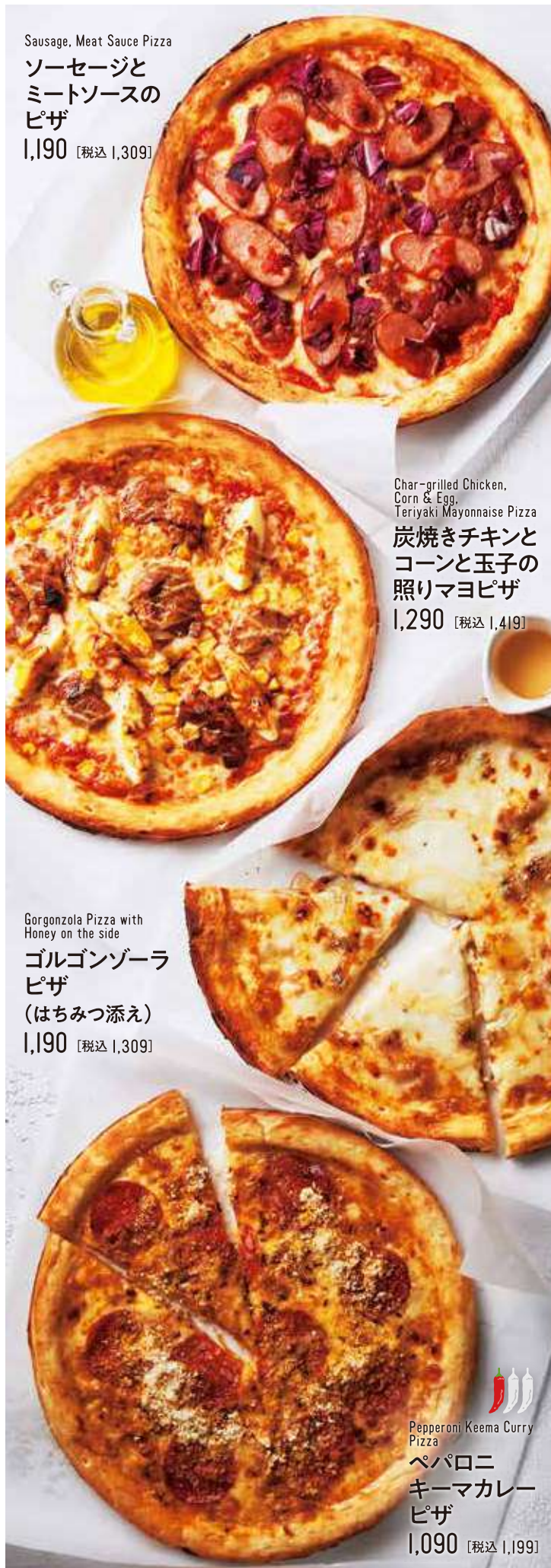
Sausage, Meat Sauce Pizza ソーセージと ミートソースの ピザ 1,190 [税込 1,309]