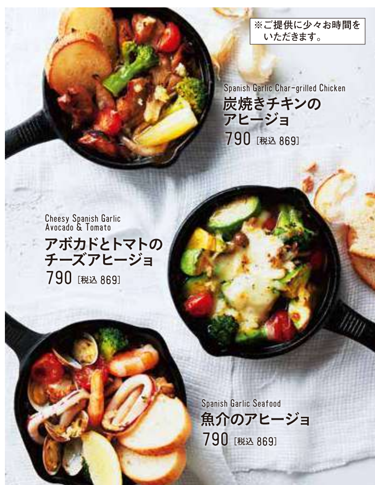
Cheesy Spanish Garlic Avocado & Tomato アボカドとトマトの チーズアヒージョ 790 [税込 869]