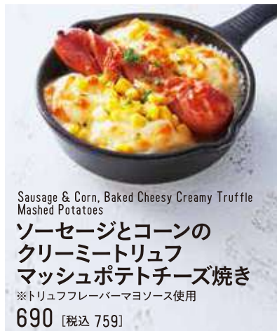
Sausage & Corn, Baked Cheesy Creamy Truffle Mashed Potatoes ソーセージとコーンの クリーミートリュフ マッシュポテトチーズ焼き ※トリュフフレーバーマヨソース使用 690 [税込 759]