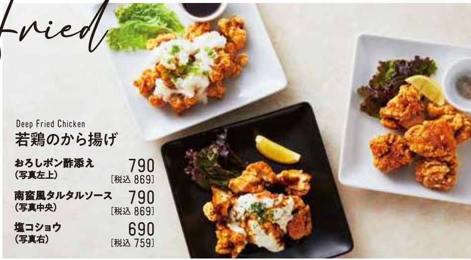
Deep Fried Chicken 若鶏のから揚げ