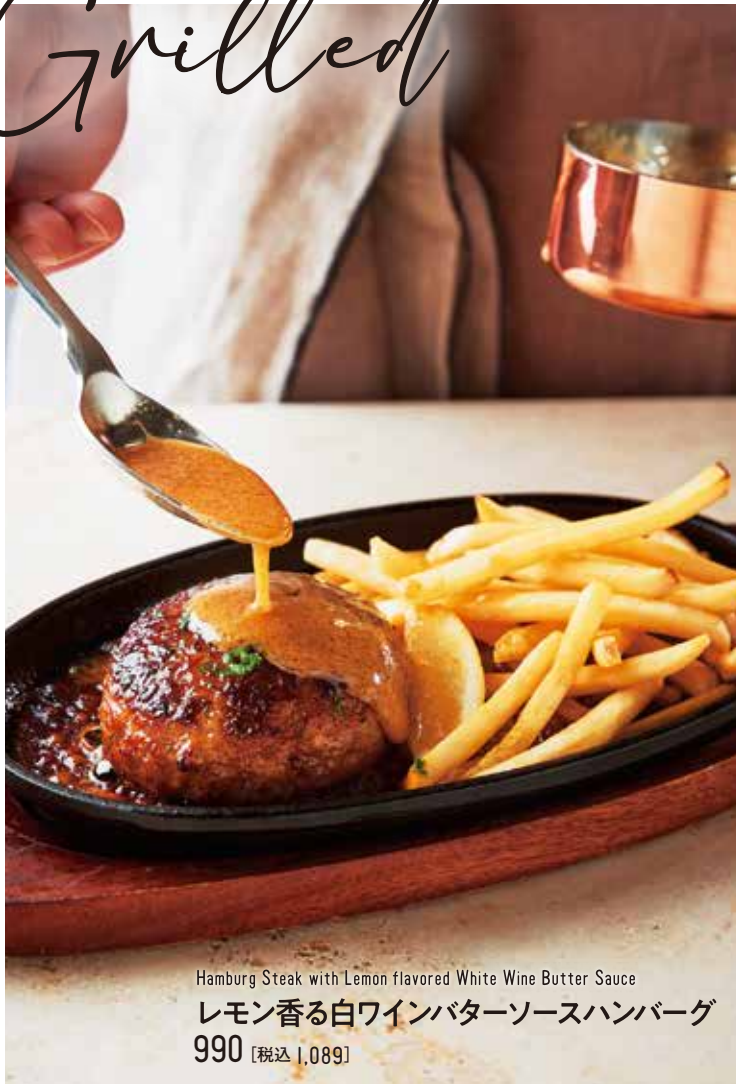
Hamburg Steak with Lemon flavored White Wine Butter Sauce レモン香る白ワインバターソースハンバーグ 990 [税込 1,089]