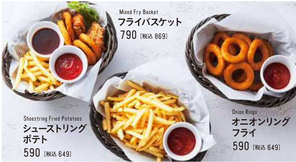
Mixed Fry Basket フライバスケット 790 [税込 869]