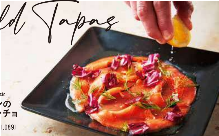
Salmon Carpaccio サーモンのカルパッチョ 990 [税込 1,089]