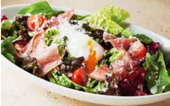
Caesar Salad with Prosciutto & Soft Boiled Egg 生ハムと半熟玉子のシーザーサラダ ●シーザードレッシング レギュラー 890 [税込 979] ハーフ 690 [税込 759]