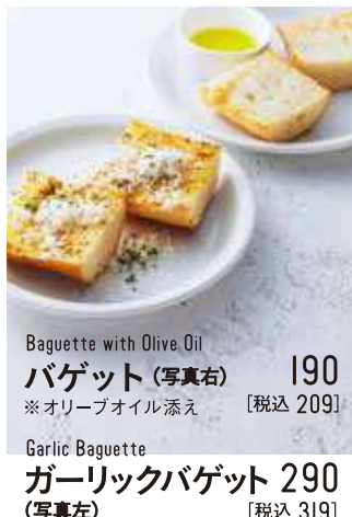
Baguette with Olive Oil バゲット (写真右) 190 [税込 209] ※オリーブオイル添え Garlic Baguette ガーリックバゲット 290 (写真左) [税込 319]