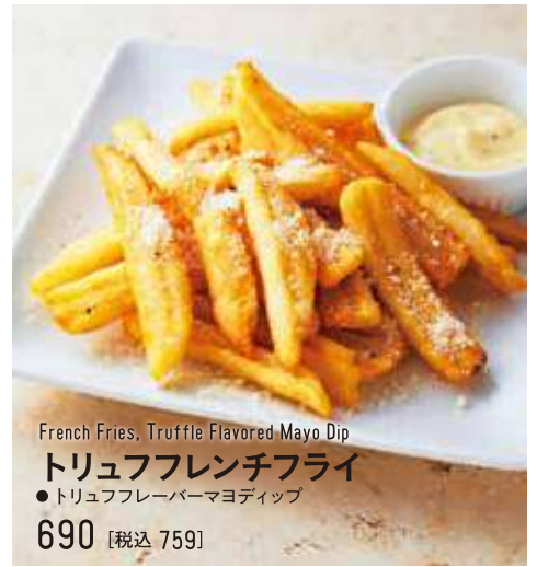
French Fries, Truffle Flavored Mayo Dip トリュフフレンチフライ ●トリュフフレーバーマヨディップ 690 [税込 759]