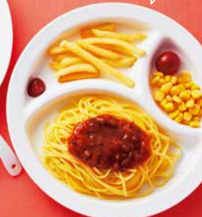
Kids' Pasta Meal パスタプレート

※消費税の計算上、レジでの精算の際に、合計額が異なる場合がございます。 ※写真はイメージです。 ※テイクアウトの場合、税率が異なりますので別価格となります。 ※店内で食べきれなかったお料理はお持ち帰りが可能です。容器代別途120円(税込132円)いただきます。(6月~9月末までの期間はお持ち帰りをお断りさせていただいております。 ※一部地域は5月~10月末まで。)