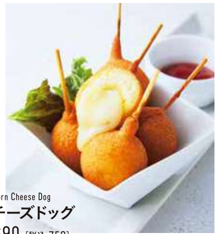
Corn Cheese Dog チーズドッグ 690 [税込 759]