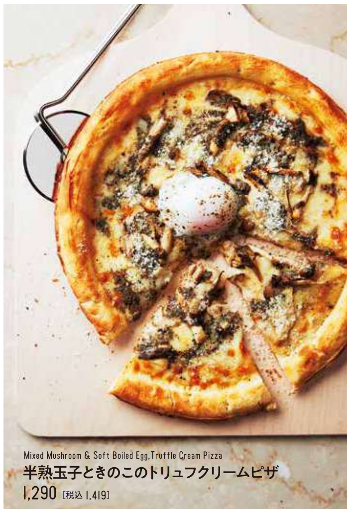
Mixed Mushroom & Soft Boiled Egg, Truffle Cream Pizza 半熟玉子ときのこのトリュフクリームピザ 1,290 [税込 1,419]