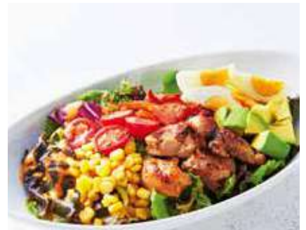
Classic Cobb Salad クラシックコブサラダ ●コブドレッシング レギュラー 990 [税込 1,089] ハーフ 790 [税込 869]