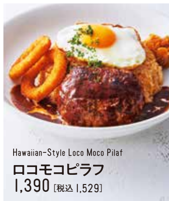
Hawaiian-Style Loco Moco Pilaf ロコモコピラフ 1,390 [税込 1,529]