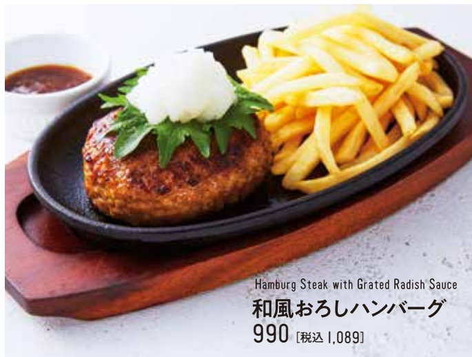
Hamburg Steak with Grated Radish Sauce 和風おろしハンバーグ 990 [税込 1,089]