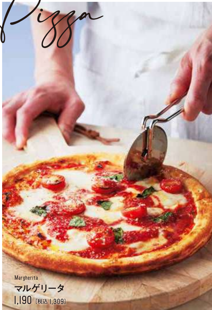
Margherita マルゲリータ 1,190 [税込 1,309]