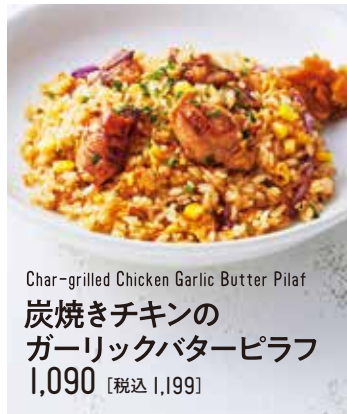
Char-grilled Chicken Garlic Butter Pilaf 炭焼きチキンの ガリックバターピラフ 1,090 [税込 1,199]