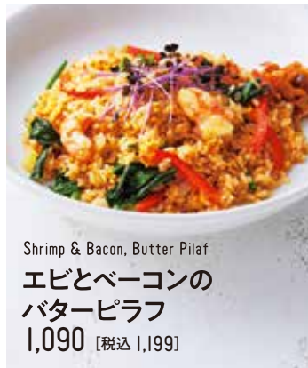
Shrimp & Bacon, Butter Pilaf エビとベーコンの バターピラフ 1,090 [税込 1,199]