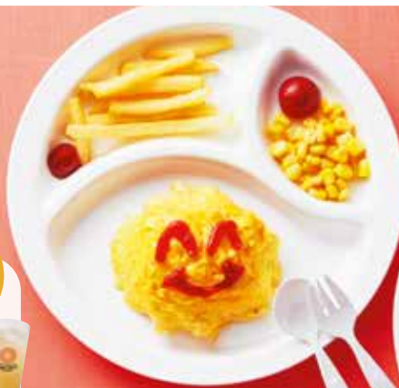
Kids' Omu Rice Meal オムライスプレート