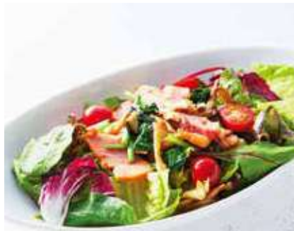
Mixed Mushroom & Bacon Butter Saute Salad きのこベーコンのバターソテーサラダ ●濃厚うまみクリーミーサラダソース レギュラー 890 [税込 979] ハーフ 690 [税込 759]