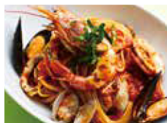
魚介と完熟トマトの ペスカトーレ + ￥100