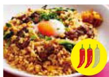
牛カルビと半熟玉子の 旨辛チャーハン + ￥100