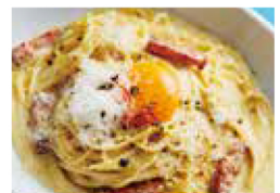
フランス産クリームチーズの 濃厚カルボナーラ