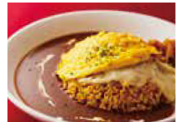
欧風カレーのチーズインオムライス