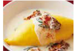
炭焼きチキンとほうれん草の クリームオムライス