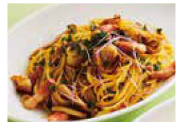
ホタテときのことベーコンの バター醤油