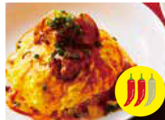
チーズタッカルビ オムライス + ￥100