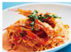
天然エビの トマトクリーム + ￥100