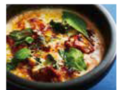
炭焼きチキンの照りマヨドリア

※表示価格はすべて税抜価格です。 ※写真はイメージです。 ※小学生未満のお客様は、ドリンクバーを全員無料とさせていただきます。(ただし同伴者の方がランチまたは単品ドリンクバーをご注文いただいた場合) ※大人数の場合は、お断りさせていただく場合がございます。