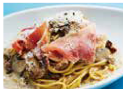
生ハムの ポルチーニクリーム + ￥100