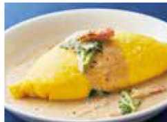
濃厚ポルチーニクリーム オムライス + ￥100