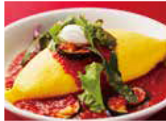
シチリアオムライス + ￥100