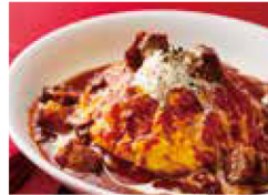
牛肉の煮込みオムライス + ￥200