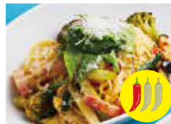
香味野菜のベジチーノ ※生姜風味