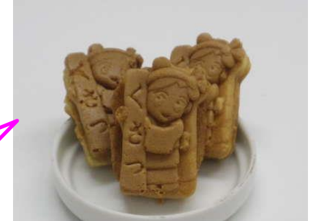
草津 湯回し娘 人形焼

夕暮れデイでは毎月お取り寄せお菓子を皆さんに楽しんでいただいておりますが、注文先のお店から商品に添えて手書きの感謝のお手紙をいただくことがあります。観光客が減り大変なことがうかがえるお手紙でした。多くの買い物はできませんが少しでもお役に立つことができているのならうれしいなあと思います。